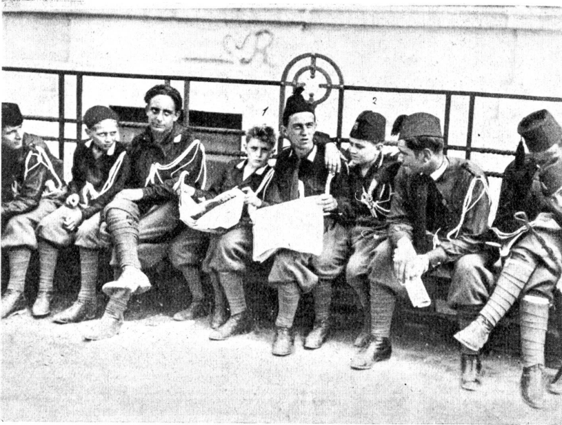
Das faschistische Kinder-Heer. Eine Abteilung jugendlicher Fascisten, unter denen sich auch die Söhne Mussolinis Bruno (1) und Vittorio (2) befinden, nach einer Truppenübung.