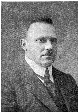
Rudolf Minger, der neue Bundesrat.

einer Geschäftsordnungsdebatte beschloß die Versammlung mit 111 gegen 110 Stimmen gegen den Antrag des Vorsitzenden, zuerst den Nachfolger von Bundesrat Scheurer zu wählen. — Es wurden 239 Stimmzettel abgegeben, wovon 6 leer und einer ungültig waren. Das absolute Mehr war somit 117. Gewählt wurde mit 148 Stimmen der Kandidat der Bauernpartei, Rudolf Minger. Auf Hermann Schüpbach fielen 57, auf Klöti 4 Stimmen. Herr Minger dankte sofort nach Verkündigung des Wahlergebnisses seine Wahl mit einer kurzen, markigen Erklärung, die mit großem Beifall aufgenommen wurde. — Schwieriger gestaltete sich die Wahl des Nachfolgers für Herrn Haab. Kandidiert waren die Herren Wettstein und Klöti. Ersterer von den bürgerlichen Parteien, letzterer von der sozialdemokratischen Fraktion. Beim ersten Wahlgang fielen auf Wettstein 91, auf Meyer 81 und auf Klöti 60 Stimmen, bei einem absoluten Mehr von 118. Beim zweiten Wahlgang war die Stimmenzahl: Meyer 88, Wettstein 87, Klöti 60. Beim dritten Wahlgang: Meyer 107, Wettstein 66 und Klöti 63. Nach den Bestimmungen des Wahlreglements fiel nun Klöti aus der Wahl und so wurde im vierten Wahlgang bei einem absoluten Mehr von 101 Stimmen Dr. Meyer mit 112 Stimmen gewählt. Dr. Meyer dankte die Wahl, ersuchte aber um eine Bedenkzeit von 24 Stunden, um mit seinen Parteifreunden Fühlung nehmen zu können. — Hierauf wurde noch mit 143 Stimmen Bundesrat Mury zum Bundespräsidenten gewählt.