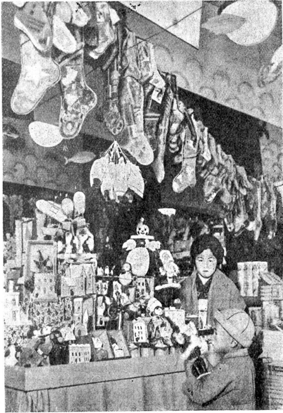
Auch in Japan ist Weihnachten das Fest der Geschenke, man beachte auch die Strümpfe, die mit Segeschenken angefüllt werden.

Grab unterm Schnee denken und an den Buben, der vielleicht in dieser Stunde nach ihr schrie, und doch so weit weg war, daß sie Tage gebraucht hätte, um zu ihm zu kommen.