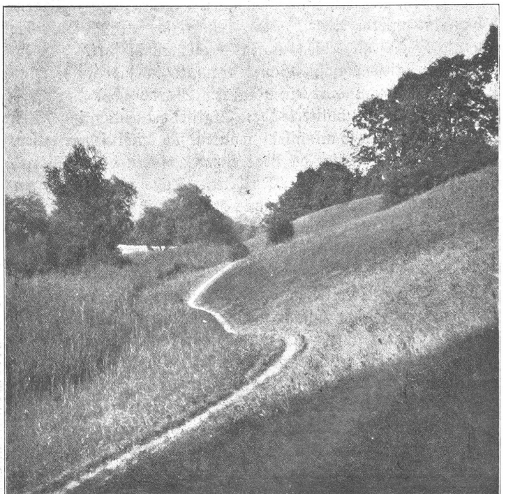
Abbild. 2. Uferweg-Partie zwischen Muri-Bad und Muri-Sähe.

Glücklicherweise also ist diese Gegend gerade den Bernern genug bekannt, als daß es nötig wäre, ihre Schönheiten mit ach! so unzulänglichen Worten schildern zu wollen. Auch die hier gezeigten Bilder vermöchten für sich allein nicht entfernt einen Begriff zu geben von den unerschöpflichen Reizen jener Landschaft. Denn sie ist vor allem auch als Ganzes schön, im Zusammenwirken von Nähe und Ferne, als lieblichstes Idyll im Rahmen der großen Linien der Aare und der Berge voll schönen Schwunges, im Reichtum und in der Frische einer urwüchsigten, fast wilden Vegetation mit prachtvollen Durchblicken auf Fluß und Alpen — ein Zauber, dem mit der Kamera fast gar nicht beizukommen ist. Und wer ihn noch nicht gespürt hat, der möge nicht mehr zögern, diese Gefilde aufzusuchen. Jedem Naturfreund, der einmal ihre Reize kennen gelernt hat, bleiben diese Gegenden lieb und teuer. Seien es die wundervollen Schilfwiesen, die sich unterhalb des Märchligengutes hinziehen, die in märchenhafter Verträumtheit ruhenden Seerosenteiche bei Allmendingen oder die prachtvoll ernsten, überraschend alpin anmutenden Ufer bei Rubigen, Riesen und