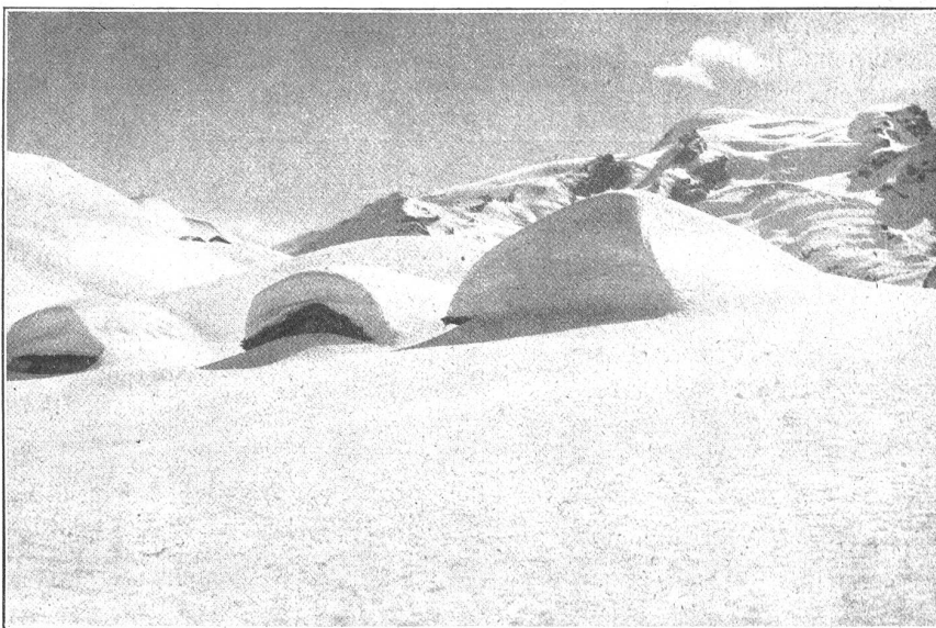
Auf Trübsee (1800 m) bei Engelberg.

Unterdessen blättertete der Sigrift vergeblich im Alten Testament; die Banknötlein wollten sich nicht sehen lassen. Doch halt — richtig, da liegt etwas zwischen den Blättern, — zwei Totenandenken. Des Alten Glaze rümpfte sich zur Hälfte. „Sapperlot!“ brummte er, und biß die Zähne aufeinander, „wieder hundert Seiten umsonst abgezählt!“ Er schlug unwirsch das nächste Blatt um und geriet ins Buch der Weisheit; aber auch das konnte keine Banknoten hervorzubringen. Eben wollte er das Suchen aufgeben, als er auf einmal ein großes zusammengelegtes Papier im Buch entdeckte. Schnell äugelte er um sich; es schaute ihm niemand zu. Vorsichtig entfaltetete er den Kapitalbrief; denn was konnte es anderes sein. Da las er in großen gemalten Buchstaben: Revidiertes Verzeichnis der Gemeindearmen. „Himmelherrschaft Donnerwetter!“ Zornig warf er den Schein weg und klappte das Buch zu. Am Kleiderkasten aber zankten sich die Sonnhaldenbäuerin und die alte Pfarrköchin, die Trud.