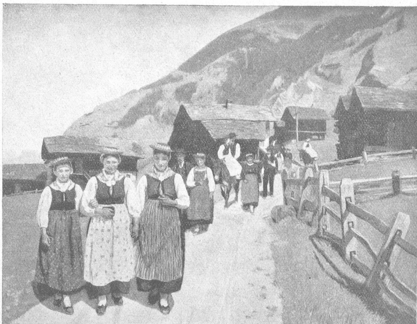
Nach der Messe im Val d'Anniviers. (Aus „Baub-Booby, Schweizer Bauernkunst“, Verlag Drell Zürich.)

Wie sie aus dem Walde kamen, hörten sie im Dörflein Schreien und Lamentieren, und als sie gegen das Pfarrhaus schritten, sahen sie davor einen gewaltigen Kreis von Leuten, besonders Weibern.