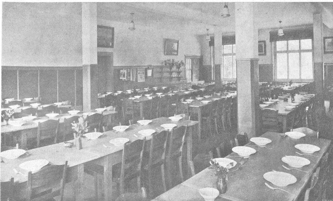
Wohlfahrts-Haus „Schmelzhof“ Klus der L. von Roll'schen Eisenwerke Klus-Balsthal. — Eßsaal.