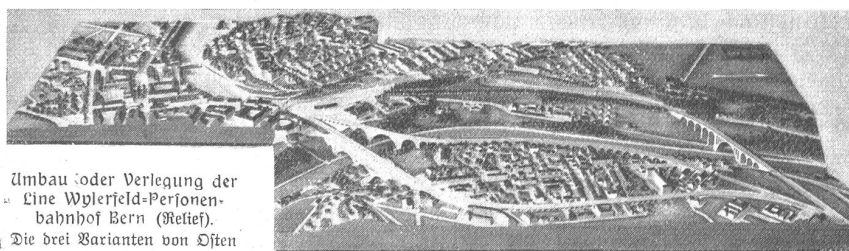
Umbau oder Verlegung der Linie Wilerfeld-Peronienbahnhof Bern (Relief). Die drei Varianten von Osten aus gesehen.