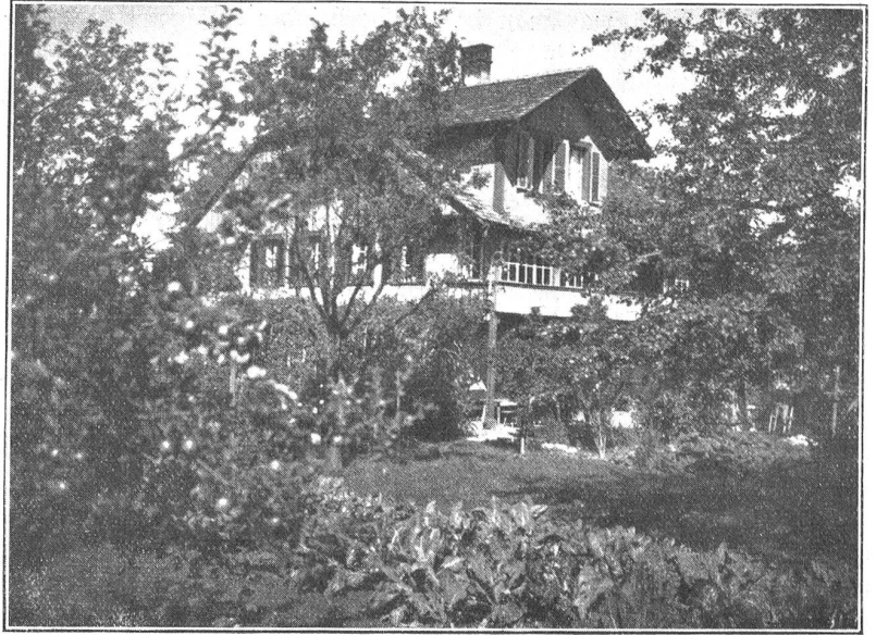
Das bisherige Krankenasyll-Gebäude in Gwatt.

ihren Lebensabend gefunden. Mögen die Freunde und Gönner in Strättligen und Thun dem Asyl treu bleiben und sich in Steffisburg mehren, um mitzuhelfen den Fortbestand der segensreichen Anstalt zu erleichtern. G.r.