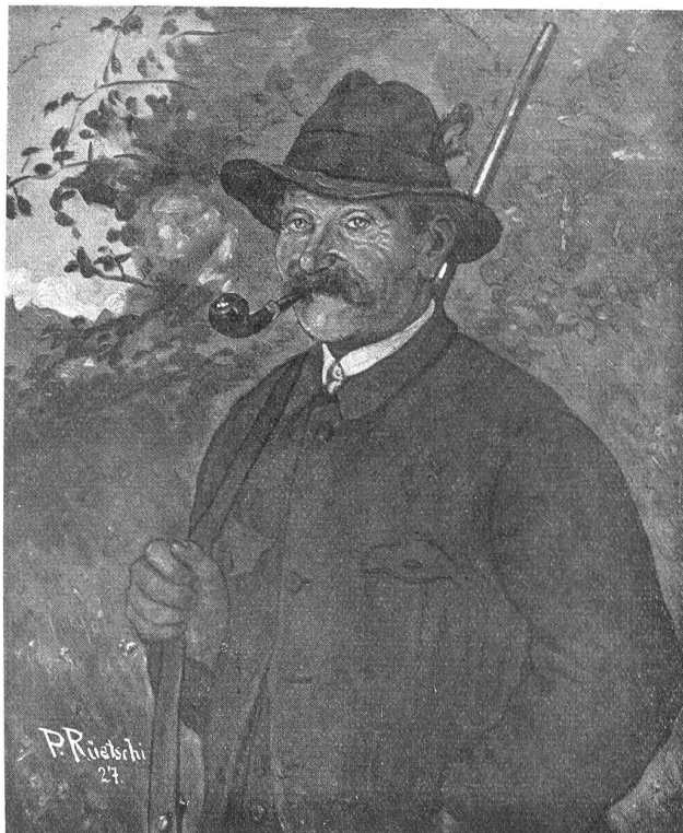
P. Rüttchi: Der frohe Jägersmann.

zusammenreimen sollten. Doch rückten sie alle allmählich heran. Voraus der Schulmeister Josebantoni, dann der alte