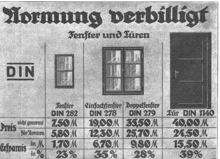
Abb. 2. Fenster und Türen, zahlenmäßige Vergleiche.

zu fassen, zu suchen, wo sich eine Normung und damit eine Vereinfachung und Ersparnis an Kraft, Zeit und Geld lohnte, aber heute schon zeigt sich vielerorts der Segen dieser Arbeit. In der schweizerischen Postverwaltung z. B. wurde die Normung der Formate bereits vor einigen Jahren durchgeführt und es ergaben sich daraus Papierersparnisse von 30 Tonnen im Betrage von 22,000 Franken. Bei den normalisierten Aufgabennummern, wie sie bei der Post verwendet werden, konnten 25,000 Franken erspart werden gegenüber früher. In der Normung der Formate für Briefe, Formulare, Drucksachen, Prospekte zc. konnte eine Einigung in verschiedenen Ländern des Kontinents erzielt werden. Welcher ungeheuren Wert aber diese Normung im Buchhandel, im Geschäftsverkehr, in Großhandelshäusern, in Banken usw. hat, sucht Abbildung 1 zu veranschaulichen. Die genormten Formate ermöglichen wiederum eine Normung der Bureaumöbel und damit auch hier Vereinfachung, Ersparnis und größere Uebersichtlichkeit. Dringend war auch das Bedürfnis nach einheitlicher Tastatur bei den Schreibmaschinen, nach einheitlicheren Farbändern. So konnten in Deutschland 10 verschiedene Farbbandbreiten auf eine vermindert werden, 30 verschiedene Farbbandspulen auf 2, 10 verschiedene Gummiwalzendurchmesser auf 2 und 40 verschiedene Gummiwalzenlängen auf 5. Die Farbbandbreite