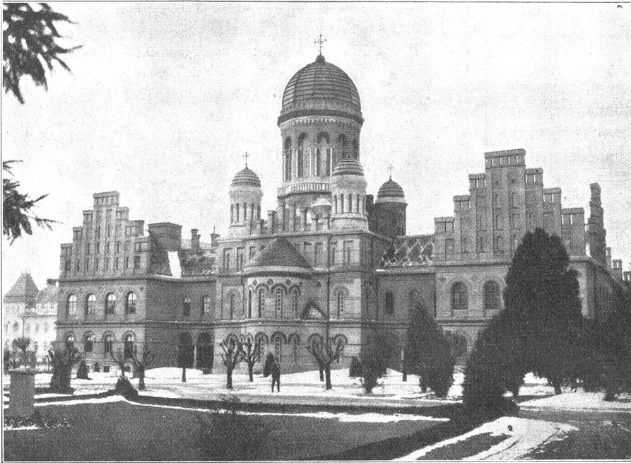
Czernowiz. — Metropolitan-Palast.

Sie bogen um die Wegkrümmung, und die Stadt lag vor ihnen. Katja machte eine große pathetische Geste und sagte: „Das ist eine blödsinnige Stadt!“