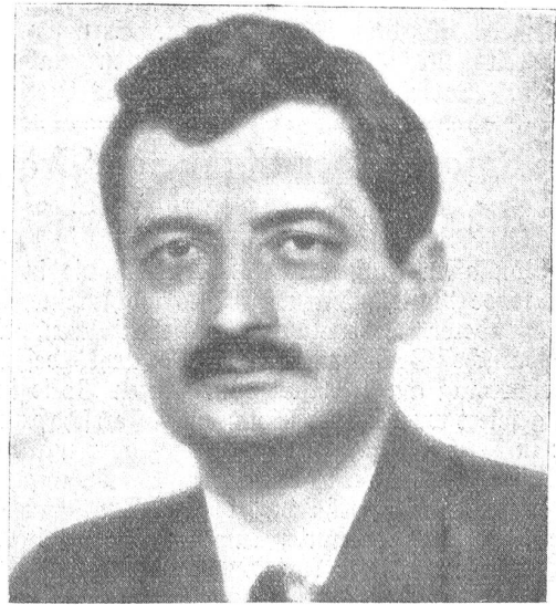
Prof. Hermann Oberth, der Konstruktor der Weltraumrakete. Er plant zunächst den Abstoß einer Rakete ohne Menschen bis 40 Kilometer Höhe.

ist, die Rakete so zu bauen, daß der Brennstoff in beschleunigtem Tempo verbrennt, so glaubt man auch, in höheren Regionen allmählich die nötige „kosmische“ Geschwindigkeit