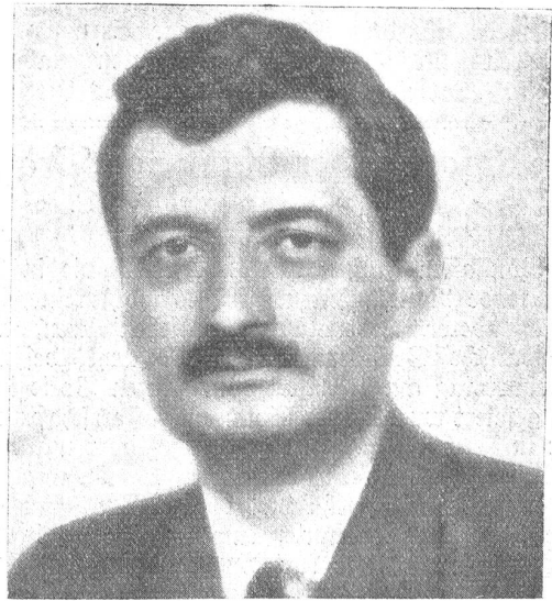
Prof. Hermann Oberth, der Konstruktor der Weltraumrakete. Er plant zunächst den Abstoß einer Rakete ohne Menschen bis 40 Kilometer Höhe.

ist, die Rakete so zu bauen, daß der Brennstoff in beschleunigtem Tempo verbrennt, so glaubt man auch, in höheren Regionen allmählich die nötige „kosmische“ Geschwindigkeit