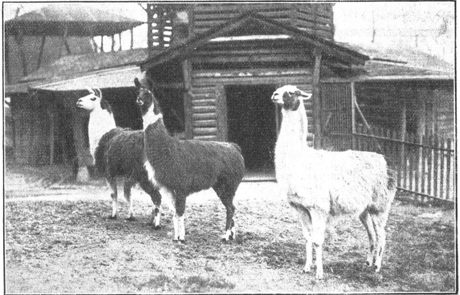
Aus dem Berner Tierpark.

Mit Beginn der Fahrplanperiode ab 15. Mai werden für eine Anzahl Schnellzüge die Zuschläge abgeschafft. Es betrifft hauptsächlich Züge, die zwischen Luzern und Zürich, zwischen