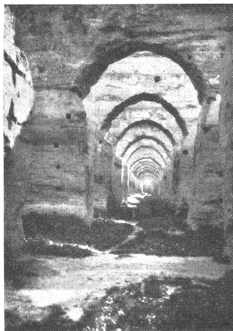
Meknes, Ecuries — die Ruinen des Marfalles des Sultans Maulay Ismail; ein Riefenbau, der Raum für 12000 Pferde und Maultiere samt Sattelzeug geboten haben soll.

Marokko ist 12mal so groß wie die Schweiz; doch war 1924 bloß eine Fläche von 24,404 Quadratkilometern — etwas mehr als die halbe Schweiz — angebaut. Die Fruchtbarkeit des Bodens hängt sehr von den Niederschlägen ab, die oft ausbleiben (das Jahresmittel für Casablanca ist mit 394 Millimeter dreimal niedriger als das für Zürich). Noch fehlen großzügige Bewässerungsanlagen. Trotzdem liefern Getreide-, Gemüse- und Obstbau schon beträchtliche Ueberschüsse für den Export. Es werden Korn, Gerste,