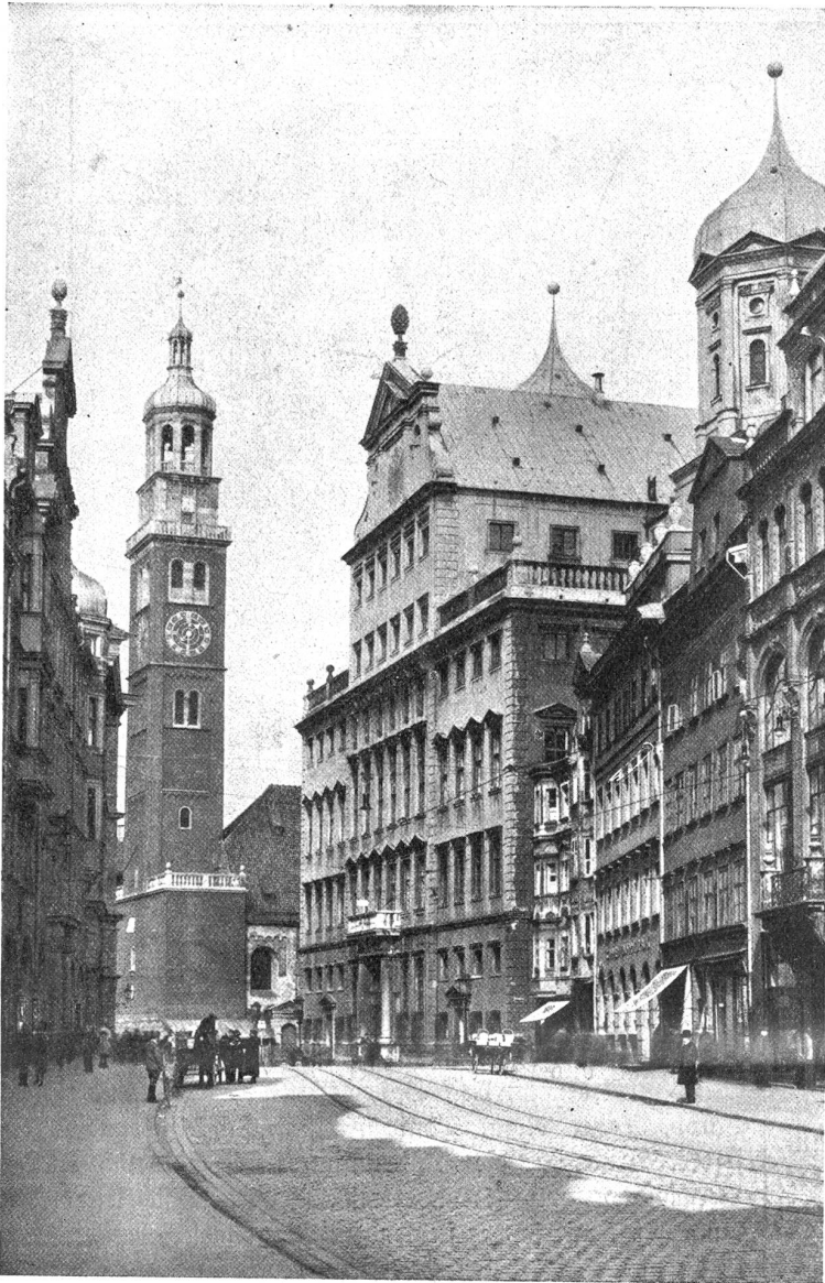
Augsburg. — Rathaus und Perlach.