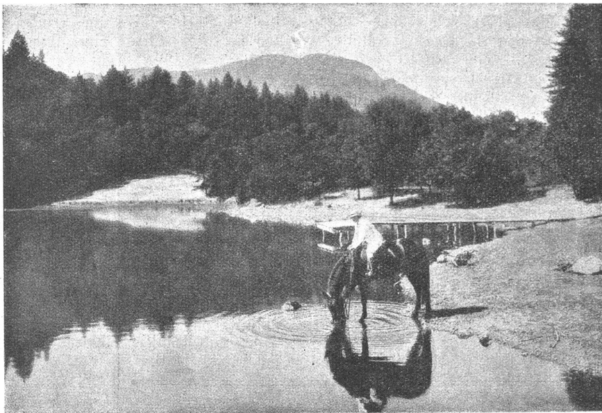
Srau Charmian London am See, der zu Jack Londons Besitzungen gehört.

Zwischenhinein fällt sein Versuch, sich den Zugang zur