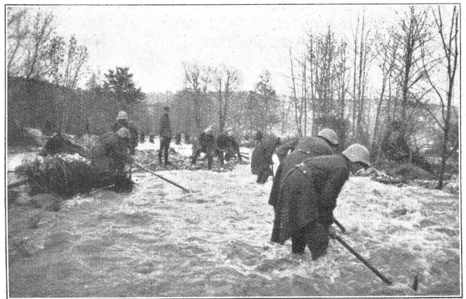
Artilleriesoldaten beim Reinigen des Fallbachbettes in der Nähe des Dorfes Blumenstein.