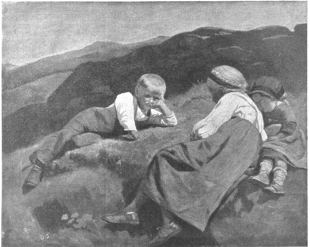
R. Koller: Kinder vom Hasliberg.

Auch in bezug auf die geistige Arbeit ist Frühaufstehen von großem Vorteil. Es ist klar, daß wir am Nachmittag