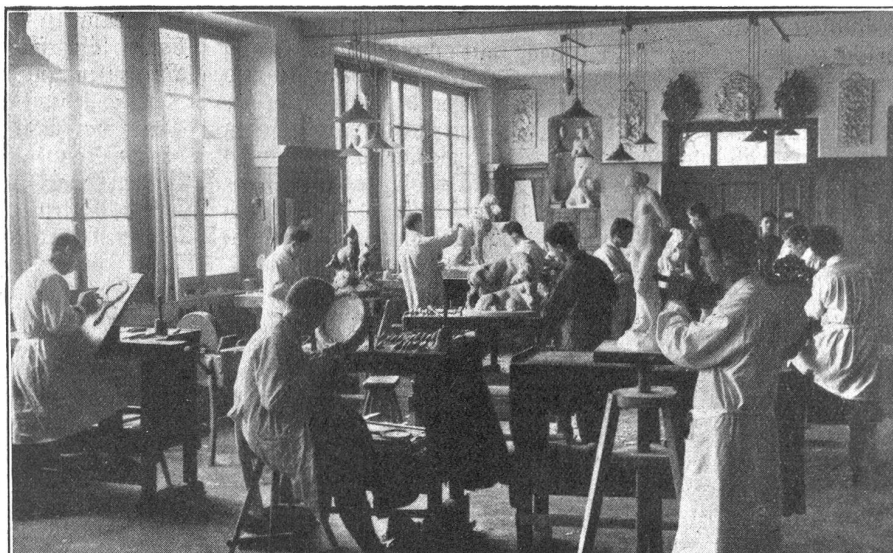
Die Schnitzerschule in Brienz.