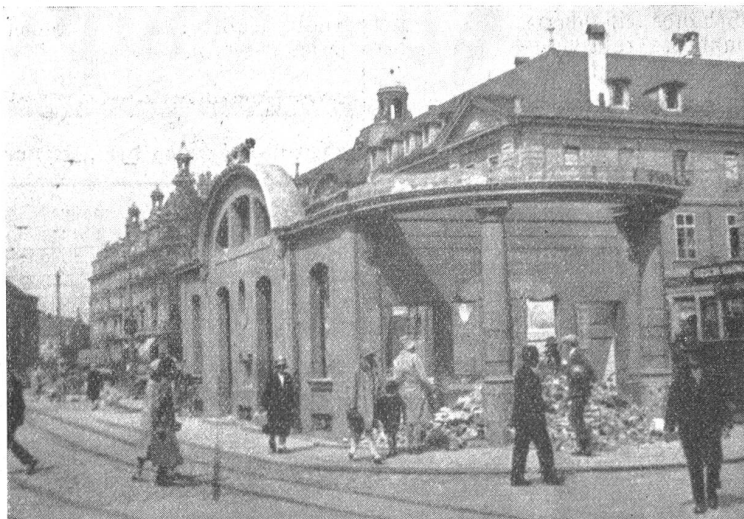
Der Abbruch des Tramhauses auf dem Bubenbergplatz.

Aber ganz genau genommen ist Bern auch heute noch keine so entsetzliche Steinvüste, daß man, wie z. B. in New York, alle paar Tage hinaus müßte, um nicht zu verfaulen. Es gibt auch außer der Innern Enge noch ganz nette „Grüninseln“ als da sind Kasinogarten, Münsterplatzform, Rosengarten etc. Und sie sind auch bequemer zu erreichen als andere Wochenendorte. Und wer unbedingt am Wochenende mit der Bahn fahren will, der könnte ja auch nach Muri fah-