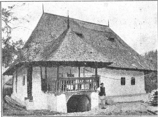
Bauernhaus in Petroschița (Rumänien).

danke auf der steilen Stiege im Flösch und hörte Miefings kleine Stimme. — Jetzt? Mit Miefing an der Brust hat sie darüber nachgegrübelt, wie dies gehn werde und