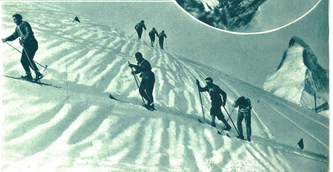
Vier Bilder aus einem großen Louis Trenker- Film, der gegenwärtig im Matterhorngebiet aufgenommen wird.