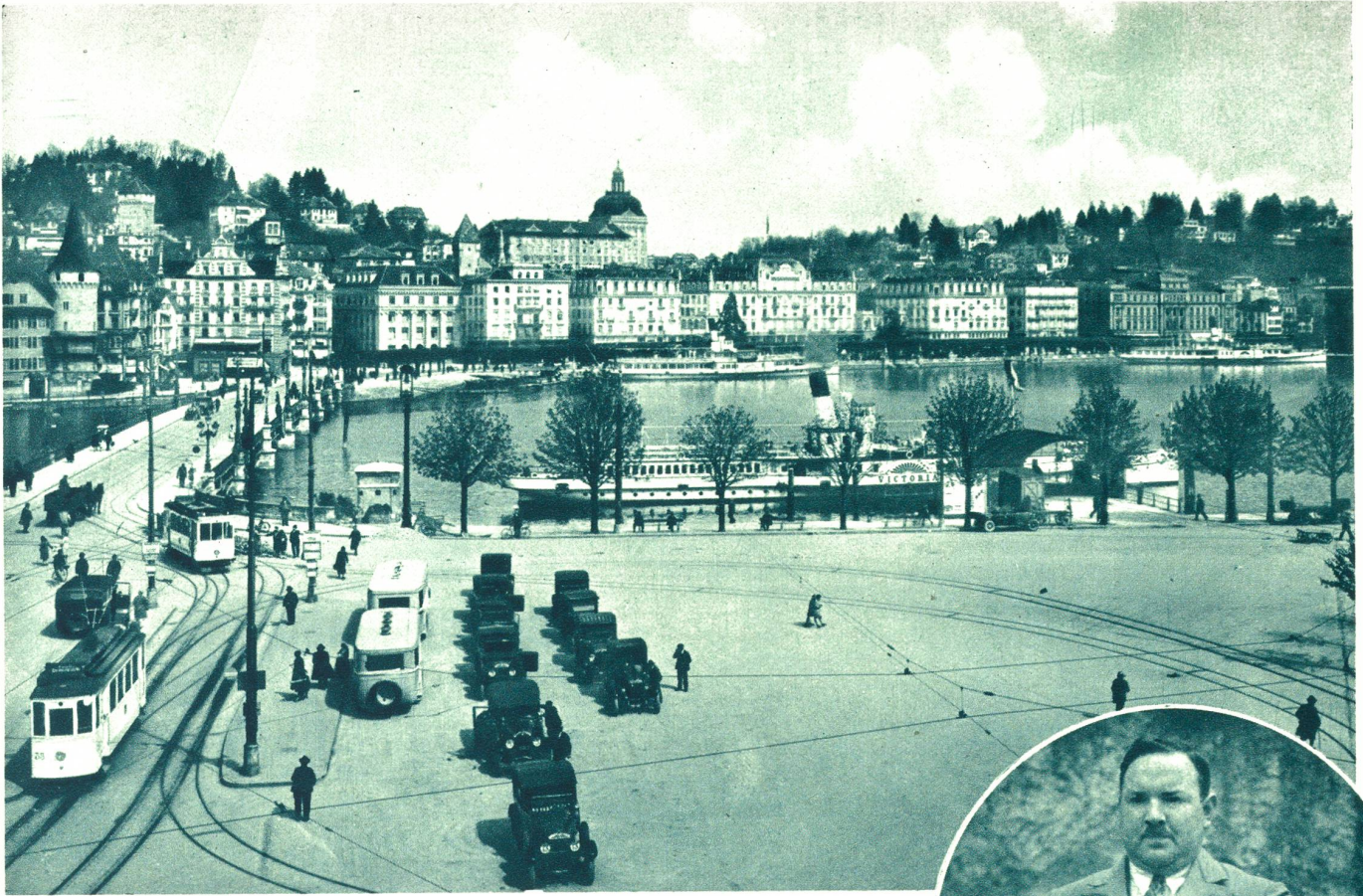
Luzern mit Seebrücke.