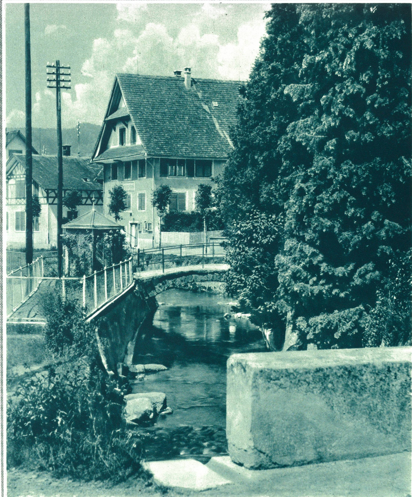
Affoltern am Albis (Kt. Zürich). Motiv am Dorfbach.