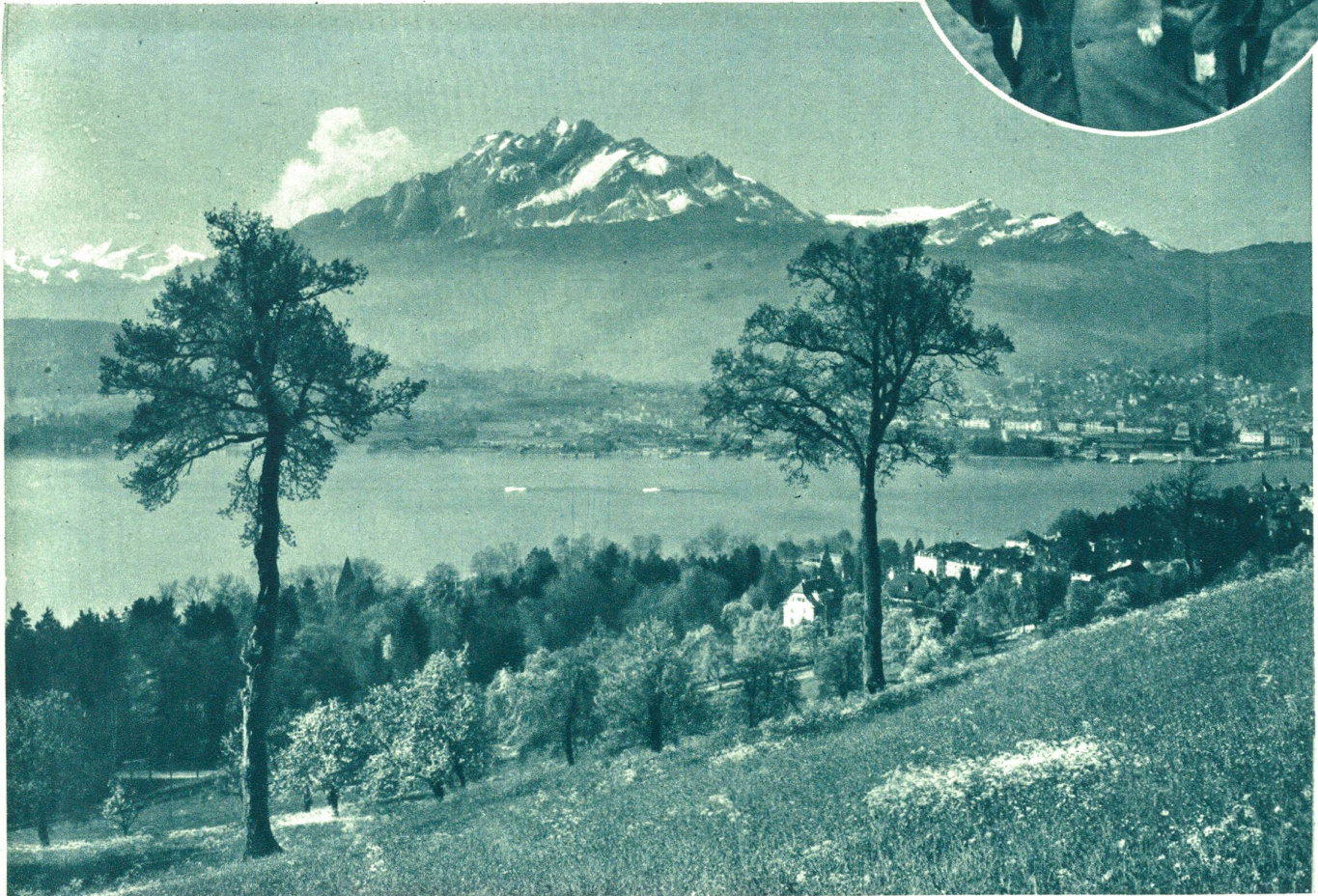
Vierwaldstättersee, im Hintergrund Luzern und Pilatus.

Rundes Bild: Die bis auf ganz wenige Tiere ausgestorbenen Entlebucher Sennen-Hunde würden in schwierigen Zuchtversuchen rassenrein vermehrt und in Escholzmatt wieder eingeführt. Der Hund ist als Treib- und Wachhund erstklassig. Gezüchtet wird er durch den Klub für Entlebucher Sennen-Hunde mit Sitz in St. Gallen.