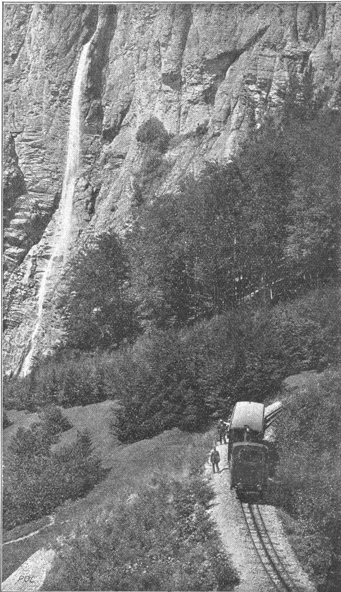
Die Briener Rothhornbahnlinie beim Mühlebadfall.

samkeit gebracht, das Gewitter, dessen Loben man über dem Frutigertal verfolgen kann, verschonte das unwettergewohnte Haus, und eine muntere Schar Touristen sorgt für den Betrieb. So kramt er aus einem Schatz der Erinnerungen an die fast 25 Jahre, die er als Bahnmeister zwischen See und Gipfel verbracht. Trauriges weiß er zu berichten: von Abstürzen leichtsinniger Touristen, von Einbruchsdiebstählen im Hotel und von jener unbegreiflichen Brandstiftung, die 1885 den für 65 Gäste eingerichteten Gasthof einäscherte. Gerettet wurde einzig das 1865 begonnene Fremdenbuch, der beredte Zeuge begeisterter Wanderer. Neben den Namen vieler Unbekannter leuchtet die Unterschrift des berühmten Arztes Es-march und der Namenszug eines deutschen Fürsten hervor. Und auch der Zeichenlehrer aus Brienz schrieb in den 60er Jahren seinen Eintrag ins Buch; er konnte nicht ahnen, daß mehr als ein Halbjahrhundert später sein Sohn einer der begeistertsten Ränder der einzigartigen Schönheit dieses Berges mit seiner grandiosen Rundschau würde: Heinrich Federer.