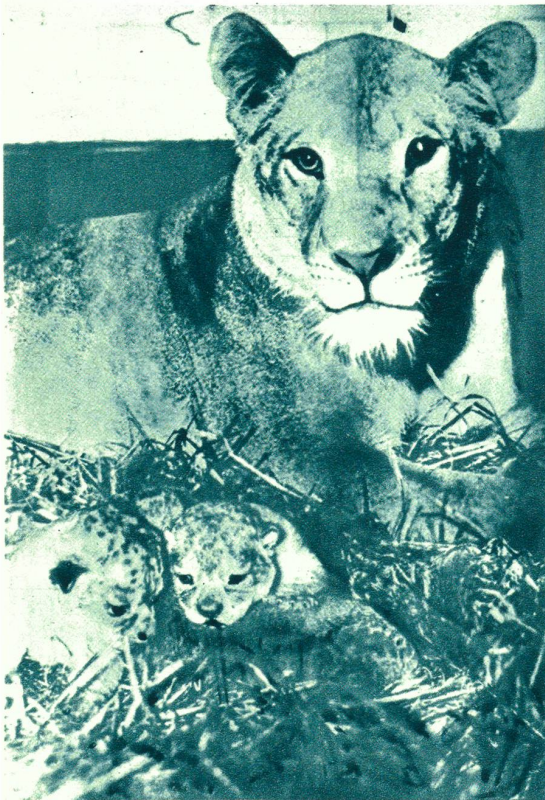
Familienbild: Löwin mit Jungen.