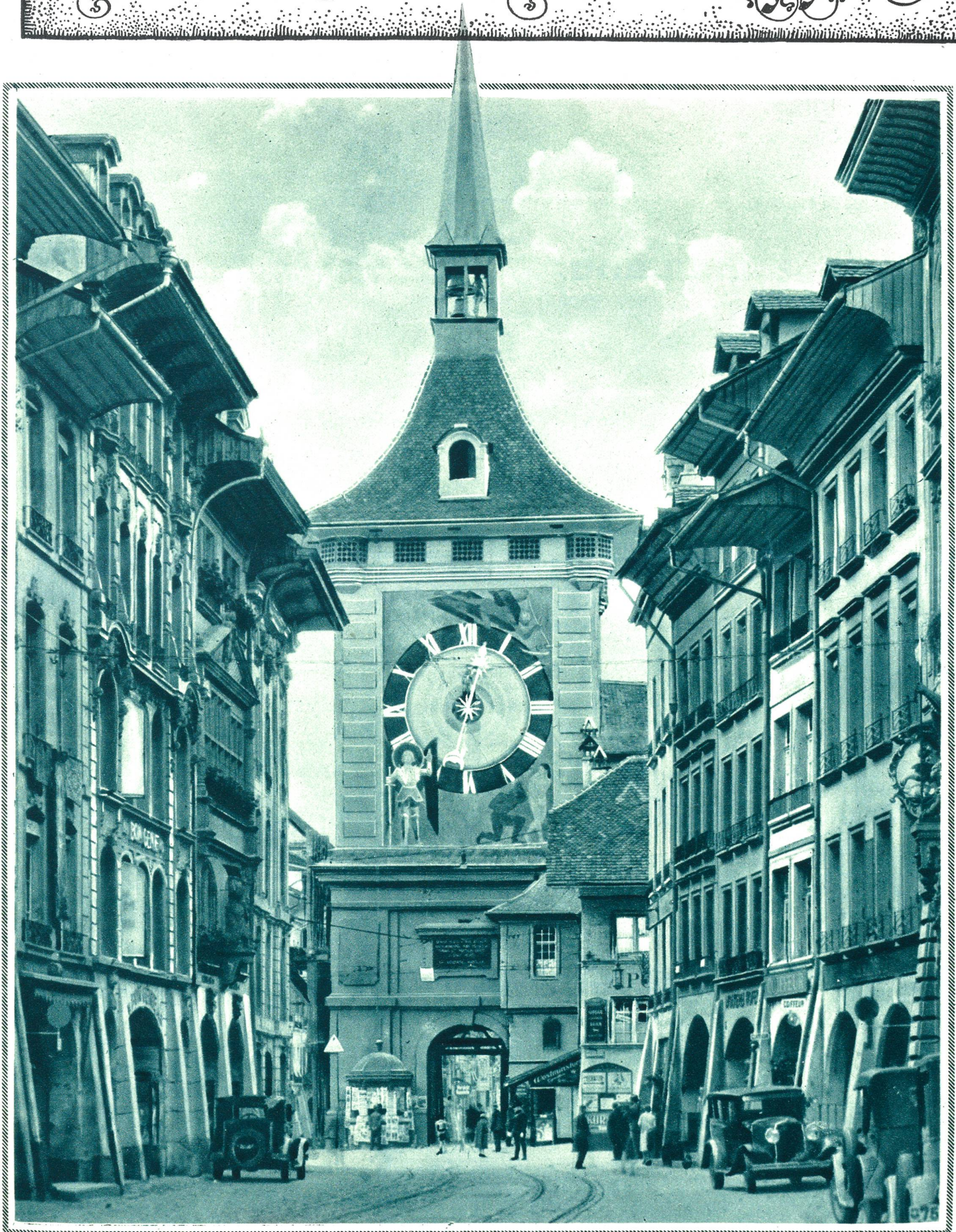
Der erneuerte Zytglogge-Turm in Bern.