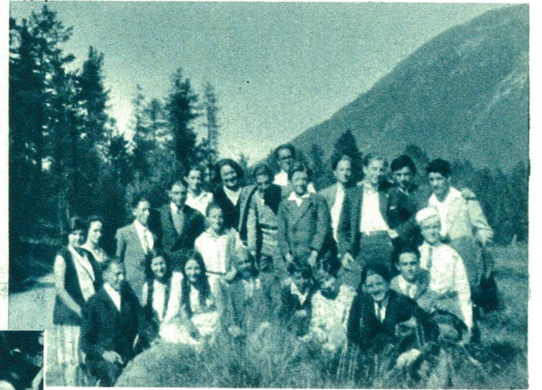
Der Ferienkurs der Bündner Kantonsschule im Engadin.