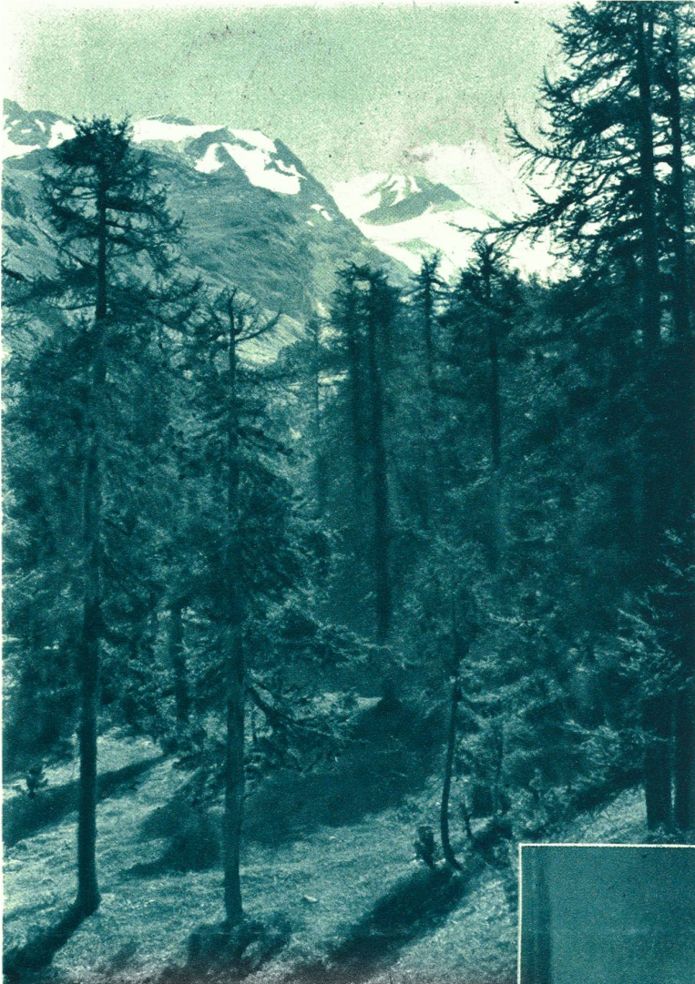
Bergwald im Fextal (Engadin).