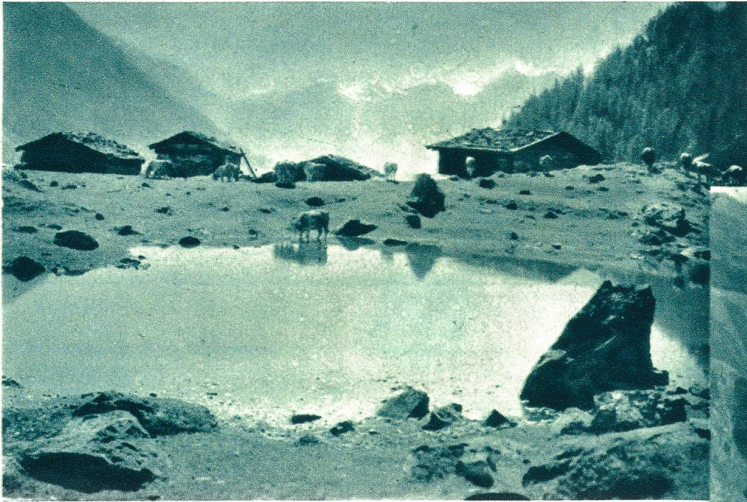
Tafler-Alp in Löttschen.