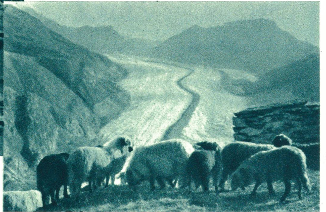
Belalp ob Mörel. Großer Aletschgletscher.