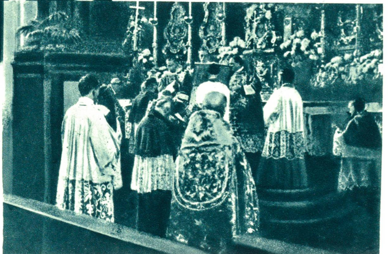
Bischofsweihe in St. Gallen.