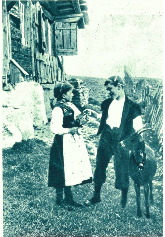
Idyll bei Gstaad.