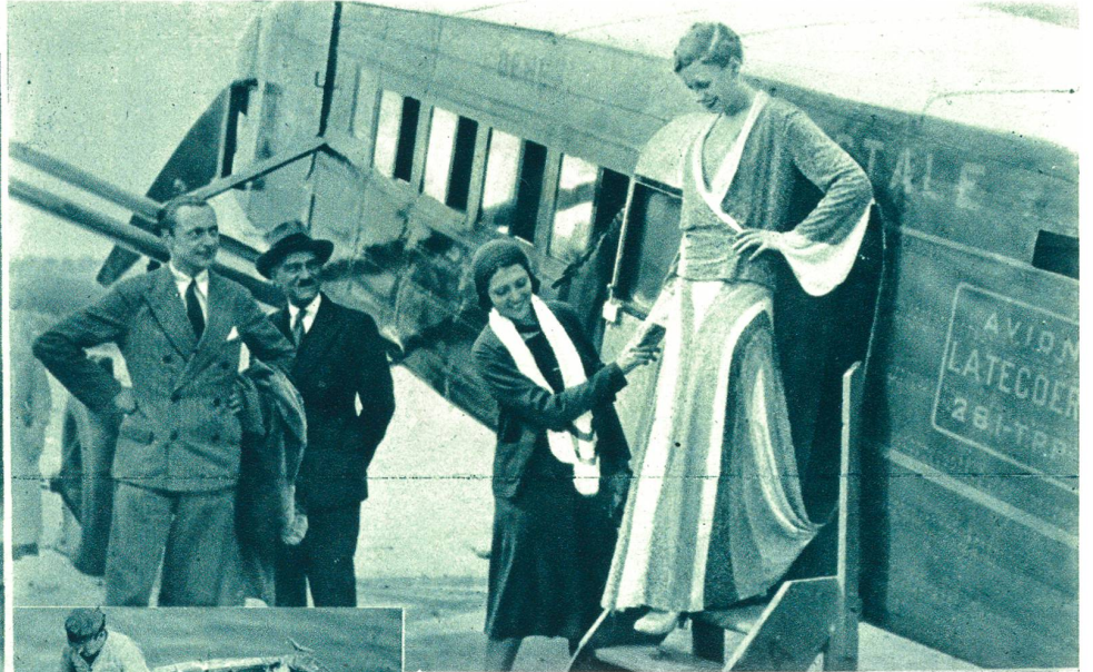
Die Flugkabine als Modosalon.