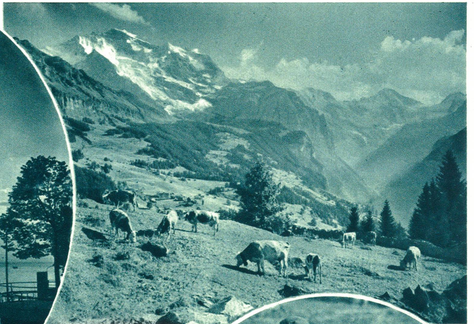
Alpidyll bei Wengen.