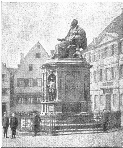
Das Keplerdenkmal in Weil der Stadt (Württemberg). Geburtsort des großen Astronomen.

Zeit gezwungen, ein trauriges Leben unter den drückendsten Nahrungsorgen zu fristen. Denn zwei Hindernisse stellten sich ihm entgegen. Einmal der Umstand, daß die großen Fortschritte der Erkenntnis die Gelehrten und Gewaltigen