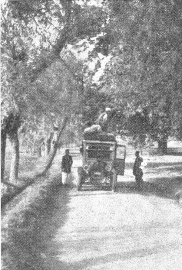
Im Zentralasiatischen Hochgebirge. — Die moderne Karawane bedient sich auch des Autos. — Bei Srinagar.