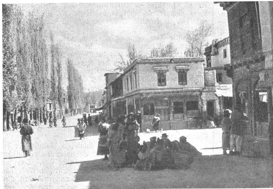
Im Zentralasiatischen Hochgebirge. — Dorfplatz in Leh.

Wie wir auf die für uns bestimmten Bungalows, verzichteten die Kulis und