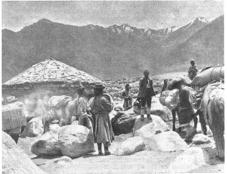
Im Zentralasiatischen Hochgebirge. — Besser als Zelt und Schaffellmantel schützen die rohen Steinblockhäuser.

Doch kommen diese Talleute nur wenig über das Lokalgebiet hinaus. Denn selbständige Karawanen sind hier nur