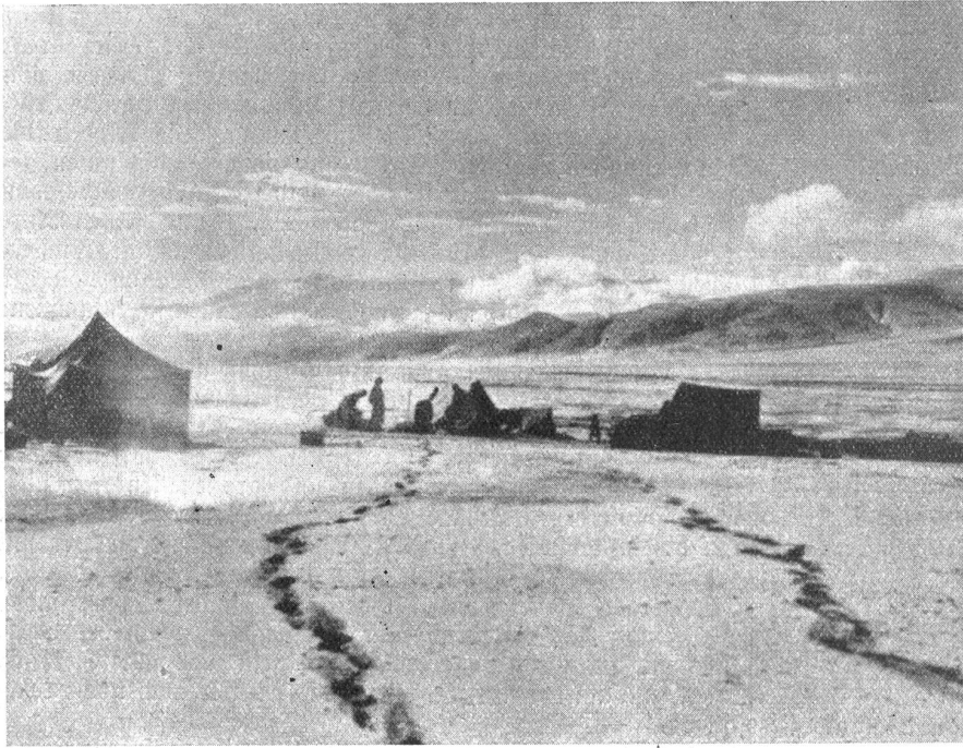
Im Zentralasiatischen Hochgebirge. — In den menschenleeren über 5000 Meter hoch gelegenen Ebenen der Aghil-Depfang-Gegend überrascht der früh einbrechende Winter nur zu oft die Karawanen.

Schrecken, der ihm voranging, ist verschwunden und nur das geheimnisvolle, freudige Ereignis ist geblieben und gibt den Kindern noch tagelang zu erzählen. Eines wissen sie nun auf jeden Fall: Es ist doch wahr, daß er alles weiß und daß er den Sack und die Rute nicht umsonst mitbringt! Darum, folgen wir lieber!