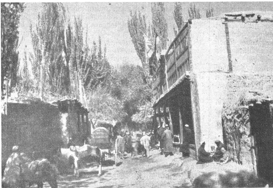
Im Zentralasiatischen Hochgebirge. — Gerne halten Roß und Rad in den ühklen Gassen des Oasendorfes.

Sechs Wochen später, am 23. Juli, verließen wir endgültig das wunder-