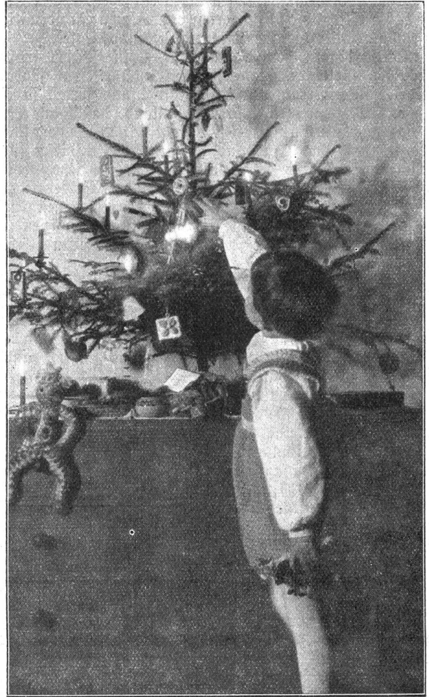
Ein kleiner Mensch — ein kleiner Baum — eine große Freude.