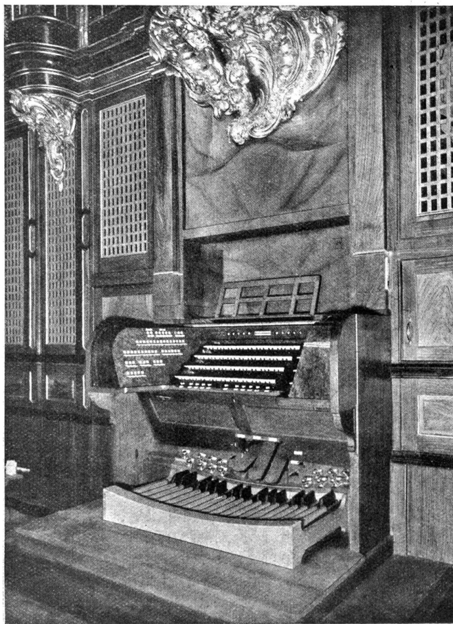
Ansicht des Spieltisches der neuen Münsterorgel.