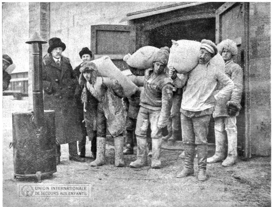
Nansen während der Hungersnot in Russland.

Die Rückbeförderung der bulgarischen Deportierten nach Thrakien.