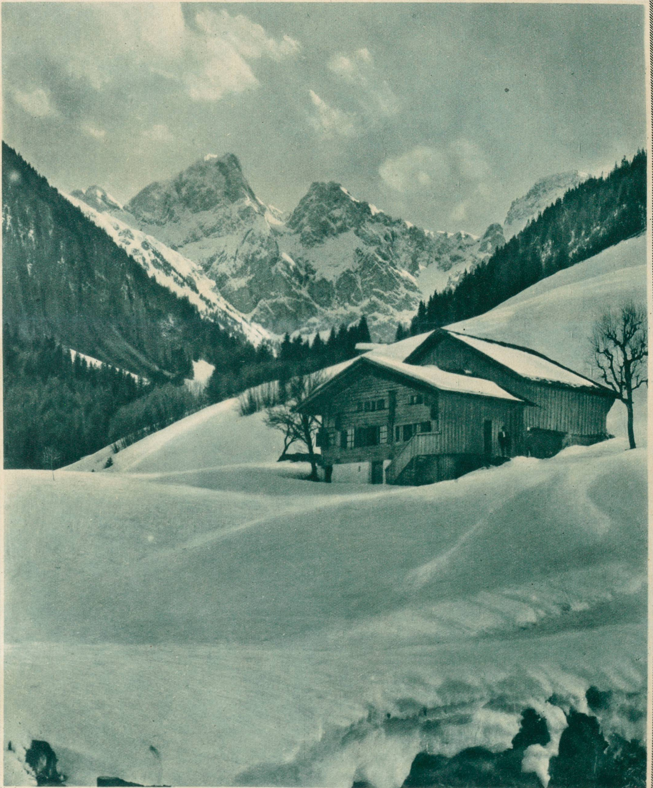
Winter im Saanenland: Château d'Oex.