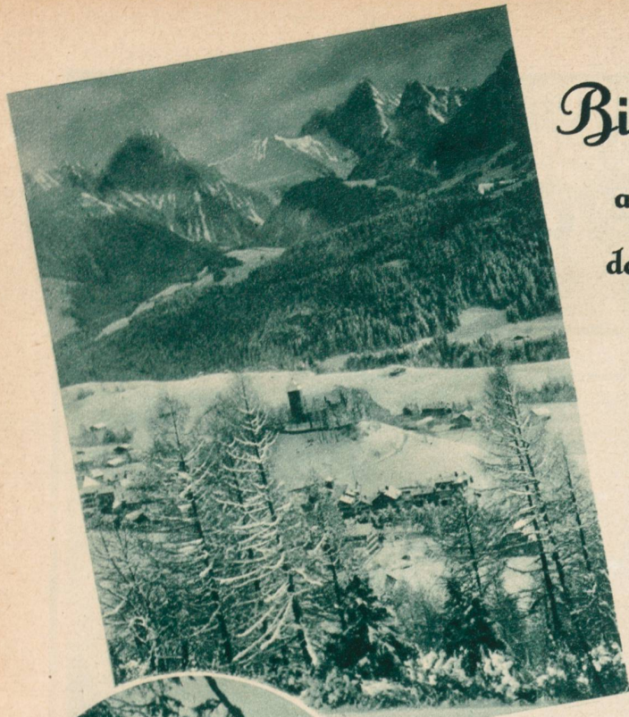
Bei Château d'Oex.