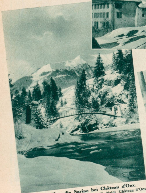
Brücke über die Sarine bei Château d'Oex.