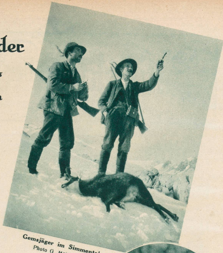
Gemsjäger im Simmental.