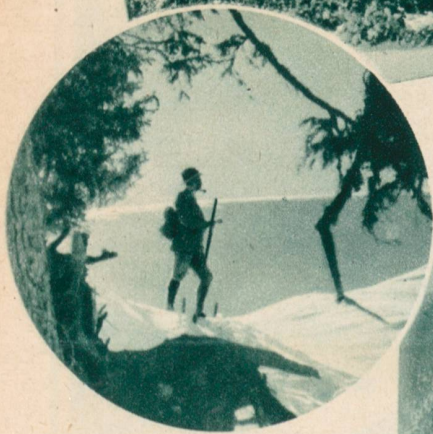
Winter im Pays d'Enhaut.