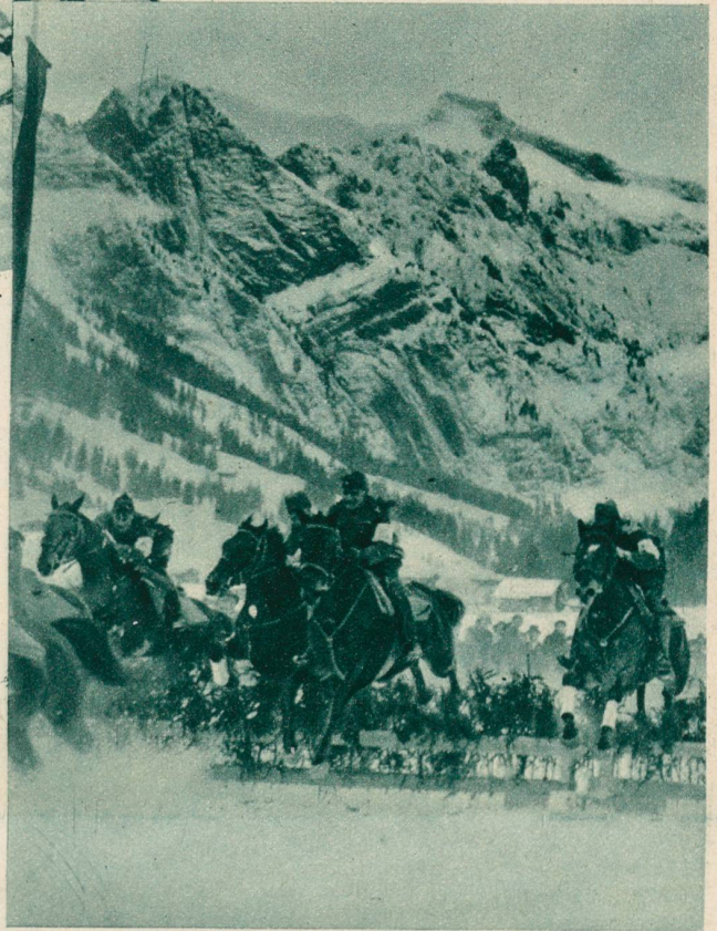
Militär-Hürdenrennen in Adelboden.

Diese kleinen Skifahrer standen schon letztes Jahr in Adelboden zum Start bereit. Sie werden gewiß alle wieder erscheinen zum 25. Schweizerischen Skirennen , welches dieses Jahr als Jubiläumsrennen am 28. Febr. und 1. März in Adelboden stattfindet.