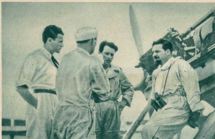
General Italo Balbo (an seinen Apparat gelehnt), der Chef des italienischen Flugwesens, der ein Geschwader von 10 Wasserflugzeugen über den Ozean via Afrika nach Brasilien führte.