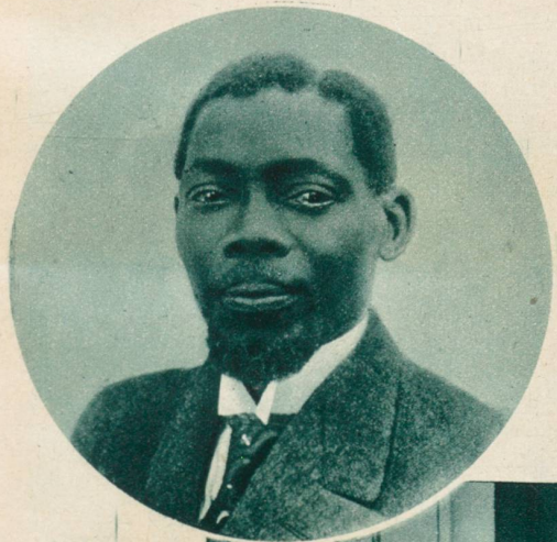
Monsieur Diagne , der erste farbige Unterstaatssekretär in einem französischen Ministerium.