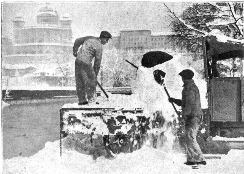
Der grosse Schneefall in Bern. Der weggeräumte Schnee kommt in die Aare.

sondern auch des seelischen Zustandes erklärbar. Es genügt eine fortgeschrittene Nervenschwäche, um uns schwer krank erscheinen zu lassen.