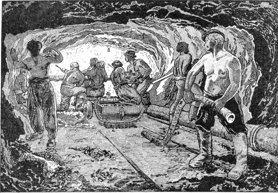
Vom Lötschbergdurchstich. — Die Arbeit im Stollen.

Mann fix und fertig bis auf die Pantoffeln, lektete in einer Hauschürze und heftig pustend auf den Knien vor dem Ofenloch, um dem Feuer nachzuhelfen. Der Doktor trommelte an die gefrorenen Scheiben und schaute mit gespitzten Lippen nach der großen Kirche hinüber, die still und weiß wie ein riesiges Zuderwerk im frostklaren Morgen stand.