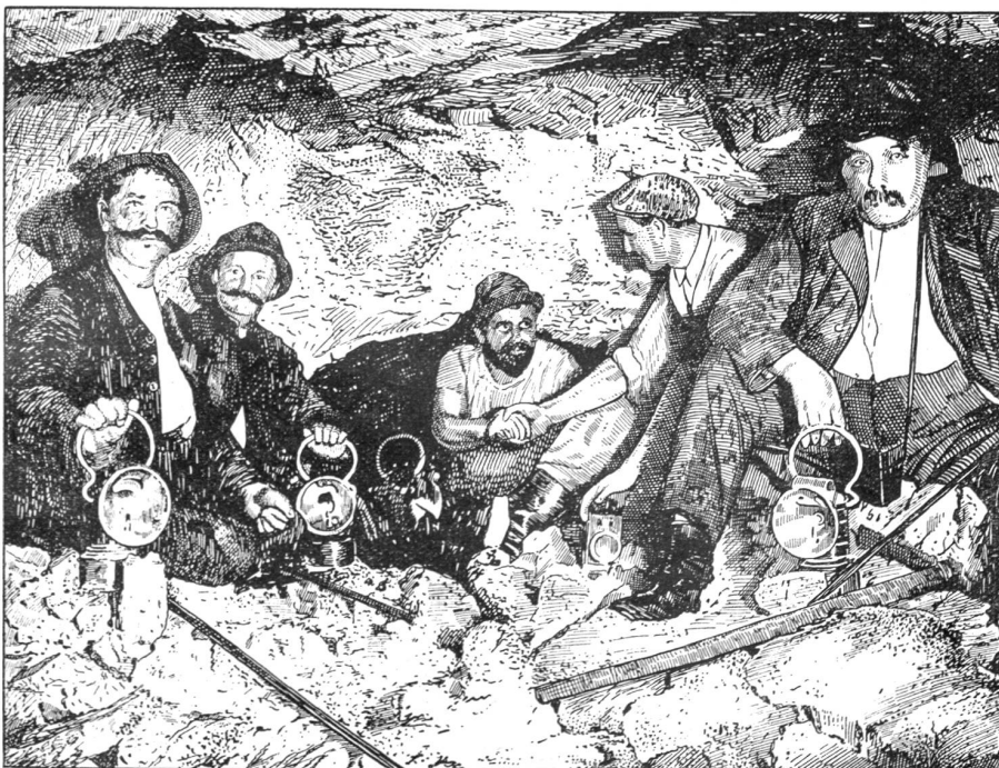
Vom Lötschbergdurchstich. — „Durch!“

senkrecht über der Einbruchsstelle eine Einbruchdoline, die eine Maximalfenktung des Terrains von 2,10 Meter ergab und von elliptischer Form war. Die Durchmesser der Einsenkung betragen 40 und 50 Meter, die Masse des eingesunkenen Terrains an der Oberfläche betrug 2200 Kubikmeter, während das in den Stollen eingedrungene Material zirka 6000 Kubikmeter ausmachte. Um dann die Stollenräumarbeiten sicher ausführen zu können, wurde bei Kilometer 1,426 bis 1,436 eine Absperrmauer im Stollen ausgeführt, die Abflußröhren für das Wasser enthielt, damit diese nicht unter Druck kommt. Wollte und konnte man es wagen, trotzdem das alte Tracé beizubehalten oder wäre ein Umgehungs-tracé nicht noch sicherer, wenn auch teurer? Gegen die letzte Lösung gab es nur ein Bedenken; ob es geodätisch möglich sei, beim Umgehungs-tracé die Tunnelachse mit Sicherheit zu finden und ob die Arbeiter vom Süd- und Nordportal sich mit Sicherheit begegnen würden. Diese Frage konnte von Professor Bäschlin, der die Absteckungsarbeiten nach dem Tode des Geometers Ma-