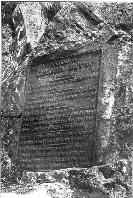
Die Tafel zur Erinnerung an Alexander Selkirk.

Defoe, der nach „Robinson“ mit allerdings ungleich weniger gutem Erfolg noch eine Reihe andere Abenteuerbücher schrieb, starb am 26. April 1731. V.