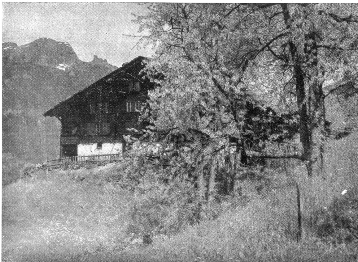
Frühling bei Wengen.

Währenddessen schlug das Wetter wieder um. Der Föhn klärte den Himmel, daß er in der Höhe das wunderbarste Blau, in der Ferne aber, wo weißgraue Wolken wie Wildgänse dahin zogen und die Tiefe des Himmels schatteten, ein merkwürdiges Apfelgrün zeigte. Es war wie im jungen Frühling.