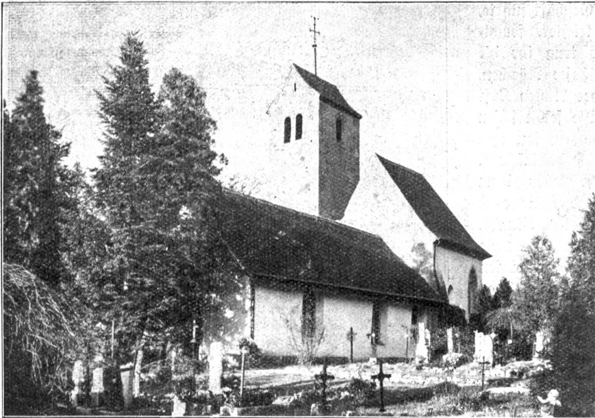
Kirche von Bremgarten bei Bern.