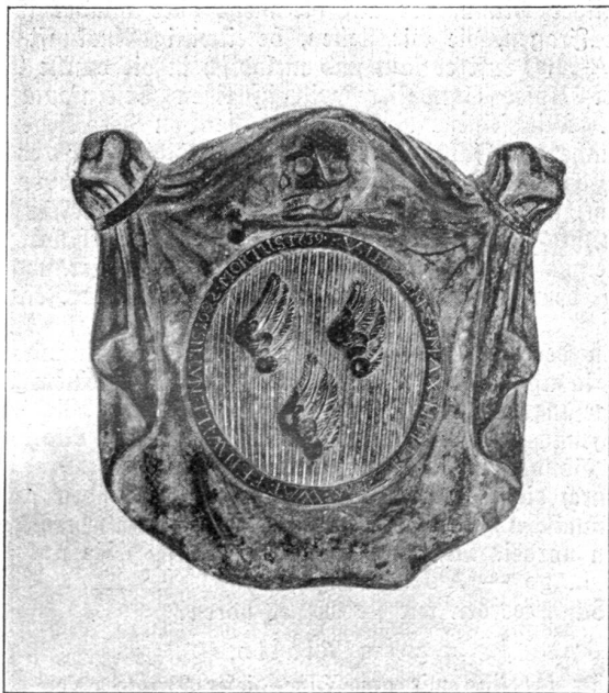
Grabinschrift und Wappen von Vinzenz Maximilian von Wattenwill, gestorben im Jahre 1739, liegt in der Kirche von Bremgarten bei Bern begraben.

Das Bremgarten Kirchlein stellt ein erfreuliches kleines Kapitel aus der bernischen Bau- und Kunstgeschichte dar.