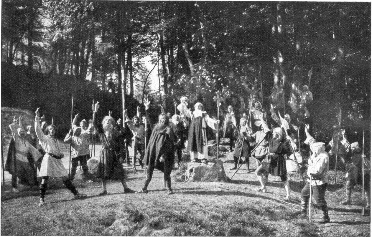
Die Tellingenspiele in Interlaken. — Der Rütlichswur.

Einganges zum Himmel empor. Wie hoch und blau war er doch! Ein paar zarte Sommerwolken fuhren leicht, rein und weiß dahin wie Schwäne. Am Rande des Horizontes jedoch türmten sich schneeige Wolkengebirge, schwermütig und sehnsuchtsvoll, still und fern und hoch wie das mächtige Haus der Seligen. Die Luft war ruhig und warm. Die Grillen schrillten im Chor. Es klang in der Stille wie eine Musik von Glas. Plötzlich sang irgendwo eine dunkle Frauenstimme ein Lied. Es klang machtvoll, traurig und schwer, wie Solfeggien oder alte Kirchenmusik. In den Pausen zwischen den einzelnen Strophen war die Ruhe ringsum gegenständlich wie eine Wand, nur durchbrochen von dem gläsernen Gesang der Grillen oder dem schläfrigen Summen der Insekten.