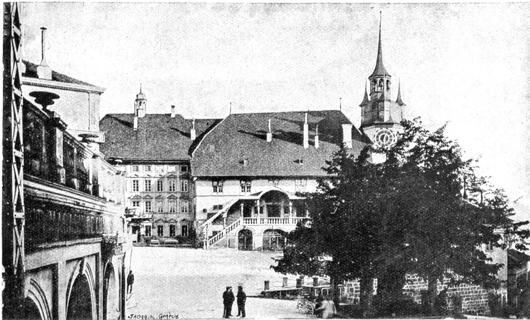
Freiburg. Rathausplatz mit Murtenlinde.

die festgefügteten Betonplatten und das massive Eisengeländer ein unbedingtes Gefühl der Gefahrlosigkeit.