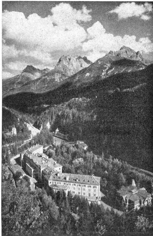
Kurhaus Tarasp mit Trinkhalle.

Zum Landschaftsbild gehört auch die Hotel- und Villenkolonie Vulpera auf dem waldigen Hügelplateau rechtsseitig des Inns, ein Kurort, dessen Name guten Klang hat in der balneologischen Welt. Vulpera ist mit Tarasp durch Wege und Waldpromenaden angenehm verbunden. Die Kurpromenade in Vulpera mit ihrem exquisiten Orchester