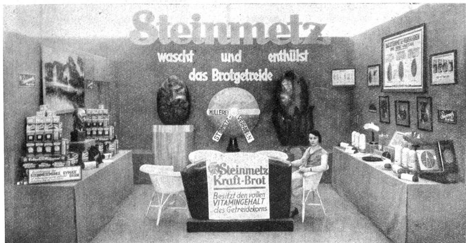
Aus der Gruppe Nahrungsmittel der „Hyspa“. — Steinmetzbrot.

schäumenden Frische, trinken wir sie ohne Kaffeezusatz, mit einem leichten Zusatz, oder am Ende bloß als zimperlische Beigabe in eine Herzklopperkaffeebrühe hinein? Es soll Bauern geben, die ihre Milch lieber in der Käseerei zu Geld machen, als daß sie gesunde Kinder haben wollen. Das unterernährte Bauernkind ist keine Ausnahme.