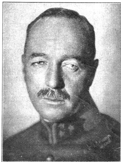
Oberstdivisionär Ulrich Wille, der neue Waffenchef der Infanterie.

Der nun in den Ruhestand tretende bisherige Waffenchef der Infanterie, Oberstkorpskommandant de Loriot, kann auf eine höchst erfolgreiche militärische Karriere zurückblicken. Bis zum Jahre 1923 in der Infanterie tätig, übernahm er den Posten des Waffenchefs der Infanterie. Im