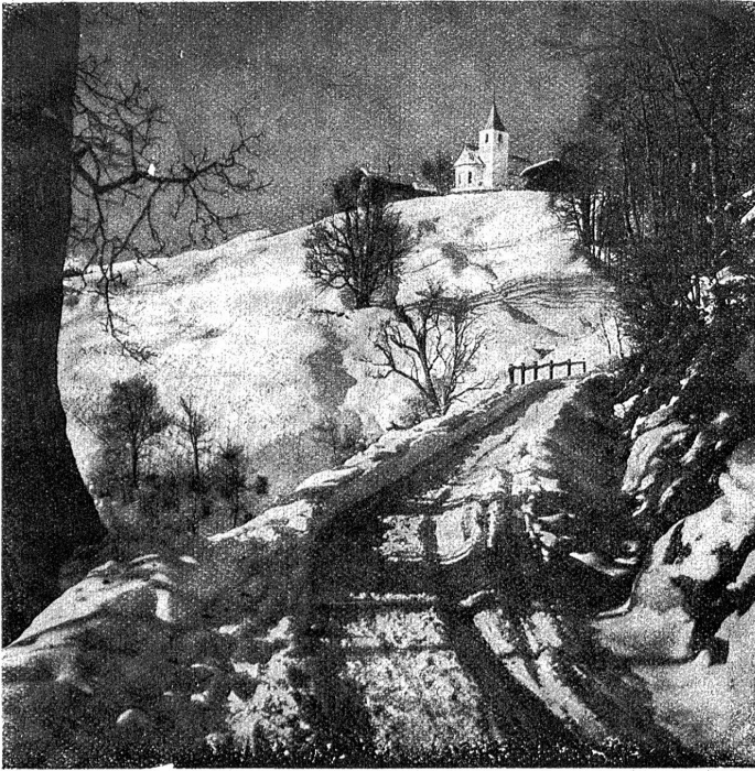
Winter im Prättigau.

Stengeln stand, so schien ihr das eigene Sein. Am besten wäre es, klagte sie, sie hauten mich ab in den wurmigen Wurzeln!