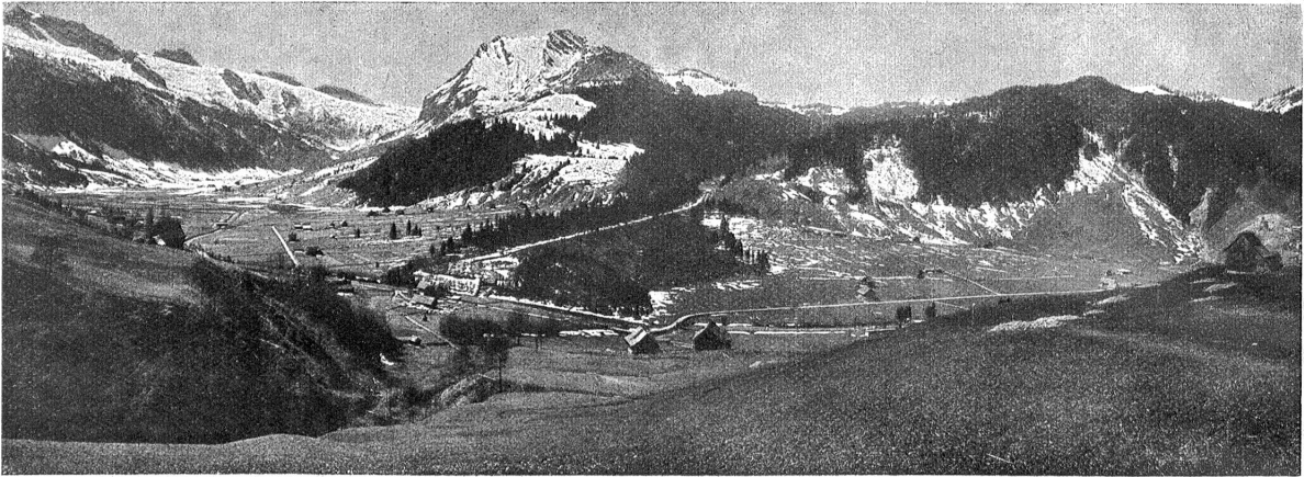
Der Calboden Innertal vor dem Ebnat, aus Südosten gesehen.