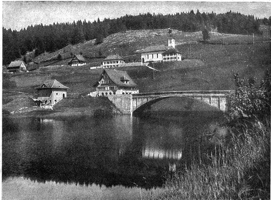
Neu-Innertal mit Kirche, Pfarrhaus und Schule der Architekten Müller & Freytag, Calwil.

Das Hauptinteresse am damaligen Bauvorgang nahm die gewaltige, 110,5 Meter hohe Staumauer im Scharf, einer schluchtartigen Verengung des Waggitales, in Anspruch, durch die der ungefähr 5 Kilometer lange und maximal 1,2 Kilometer breite Stausee Innertal entfiel. Das Gesicht unserer Heimat erfuhr dort eine einschneidende