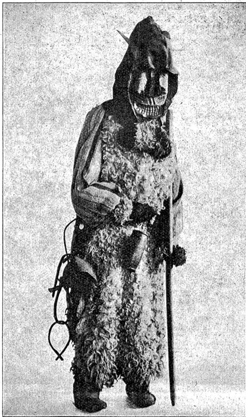
Ob- und Nidwälder Maskenkostüm.

Das will ich keinesfalls, ehe es durchaus nötig ist! sagte der Kaspar Hediger so treuherzig, daß seine Frau