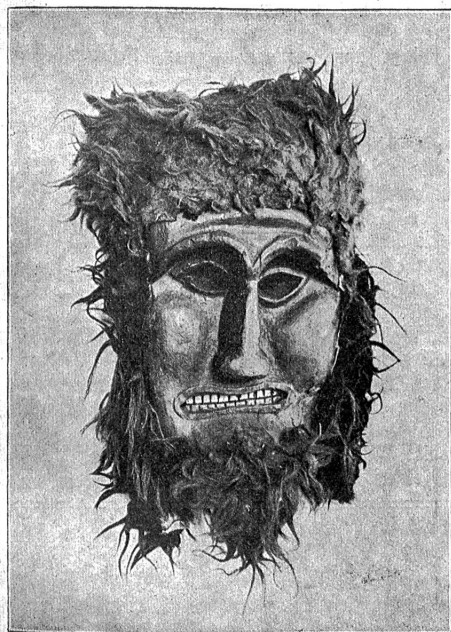
„Kolt-Tschägääten“-Maske. Löffenthal. (Museum für Völkertunde Basel.)

recht häßlich!" ist die Losung der „Hudelweiber“, die in schauerlichen Hudelfestgen gegangen kommen. Da ist gar ein „Hudelweib“, dem aus dem Hals ein zweites Hudelweib