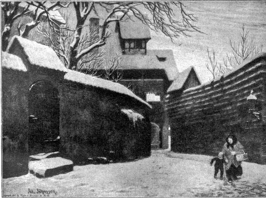
Ad. Jöhnsen: Winteridyll.

und der Doktor mußte die Ellbogen stemmen, nicht mit in den Schwall zu geraten. An einigen Wagenfenstern sah er winkende Hände; Eugenie ließ gerade das ihrige herunter. Er war mit wenigen Sprüngen da und befam von ihr einige Gepäckstücke heraus gereicht, eine Hutschachtel und eine Schirmrolle, die er mit wilder Freude als Margherita zugehörig erkannte.