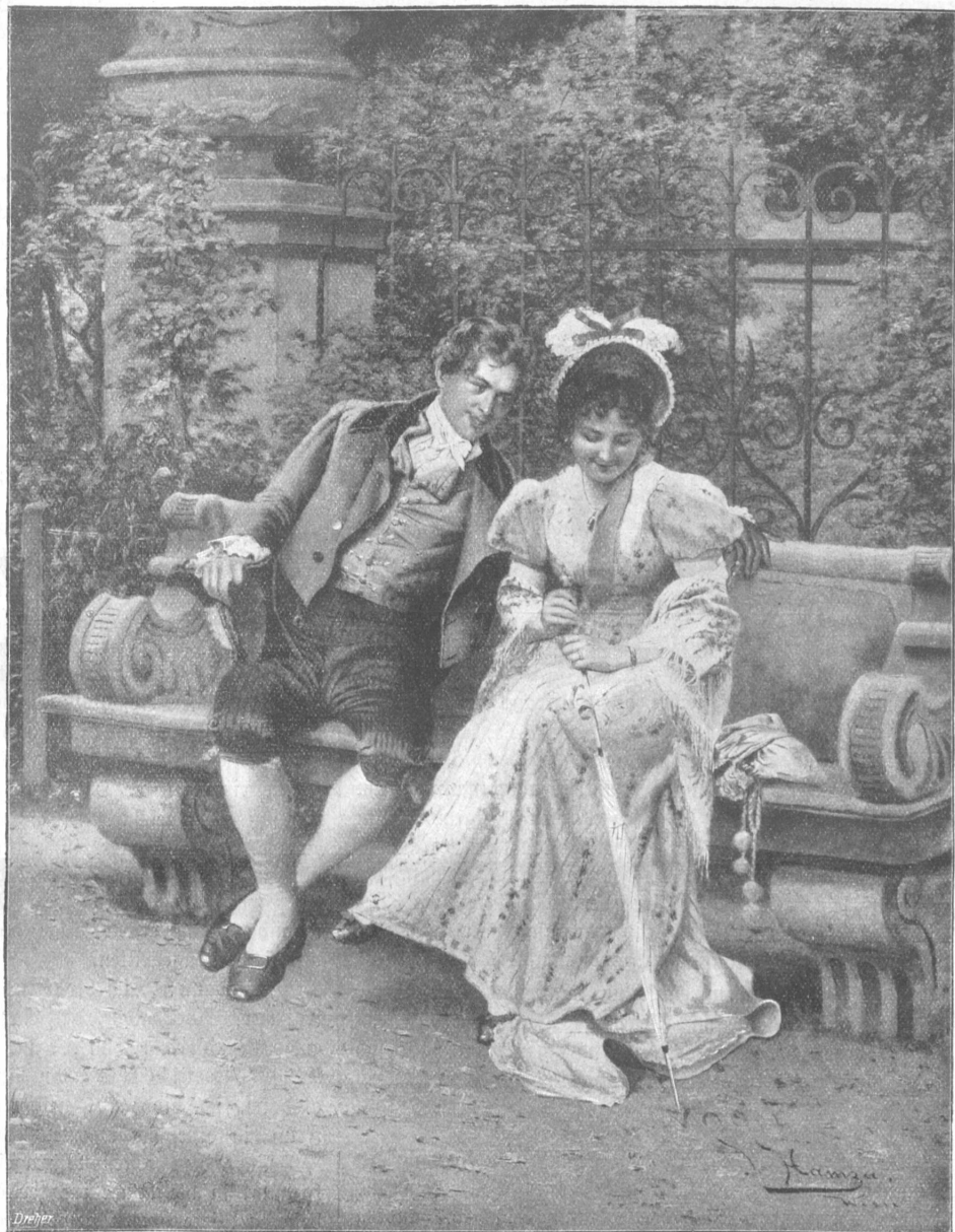
Eine Frage. Nach dem Gemälde von J. Hamza.

Blenninger öffnete schon den Mund zur Frage: „Was hast denn wieder für an Schmarrn?“, aber er schloß ihn und schwieg.