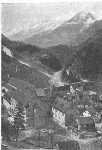
Die Kraftzentrale Amtegg.

Schon das Werden der Gotthardbahn ist ein Zusammenfließen der Völker-solidarität. Nie hätte die kleine