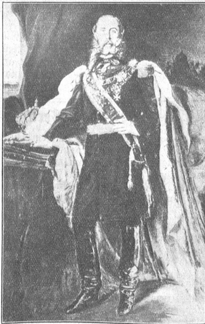
Kaiser Maximilian von Mexiko.

Als sich in der Konvention von London am 31. Oktober 1861 der religiöse Eifer der Königin Isabella von Spanien, die Neigung des französischen Kaisers, Napoleon III., für hochfliegende Pläne und der fanatische Ehr-