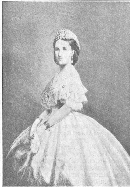
Kaiserin Charlotte von Mexiko.

heute in Schanghai) die Interessen der Fremden gegen die Gefahren der chaotischen Zustände im Lande zu schützen, da ahnte bereits das französische Volk und mit ihm die