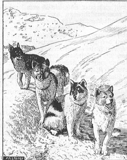
Polarhunde der Jungfrauabahn.

Nach dem Morgenimbis bringt uns des Teleskop auf der Aussichtsterrasse manche interessante Einzelheit aus dem weiten weißen Reich nahe, und angehende Segelflieger können hier die Flugkünste der zahlreichen Alpendohlen studieren. Durch den 240 Meter langen Sphinxstollen gelangen wir neuerdings ins Freie; vor seinem an eine Eisgrotte erinnernden Ausgang erwartet uns eine Ueberraschung: Polar-