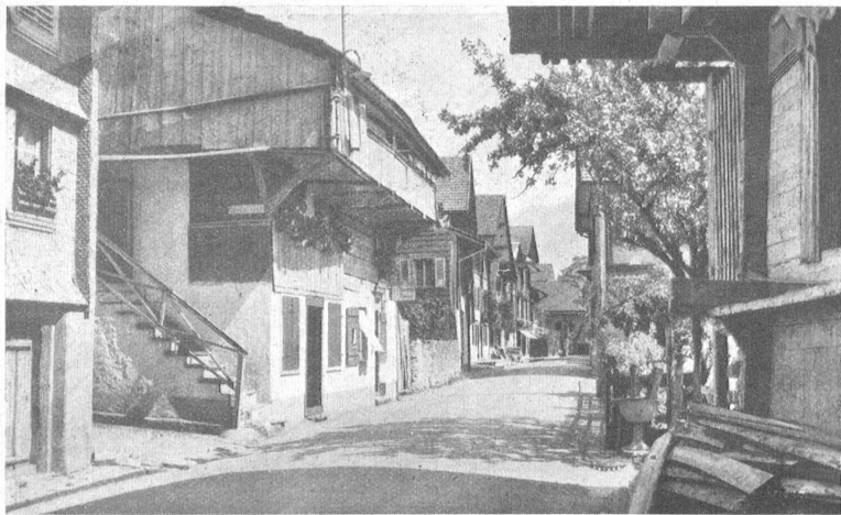
Straßenpartie aus Brienz.

Und nunmehr stand sie als Mizzi Spera vor ihrer überraschten Mutter, die durch so viel Vornehmheit beinahe befangen wurde.