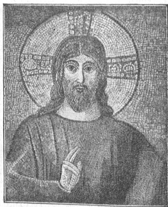
Abb. 5. Bildnisausschnitt aus dem Apfismosaik der Kirche des Lateran. 5. Jahrhundert. Sogenannter aszetischer Typus.

Die künstlerische Darstellung Jesu begann in den Kreisen der christlich gewordenen Griechen schon sehr früh; aus den Kreisen der Judenthüm ist wohl mit gleichzeitigen bildhaften Gottesdarstellungen nicht zu rechnen. Aber diese Darstellungen der griechischen christlichen Künstler waren in künstlerischem Sinne griechisch-konventionell und zwar nach dem Vorbild der griechischen Philosophenbilder geformt und hatten, wie aus den Schriften des Kirchenvaters Eusebius deutlich hervorgeht, keinen Porträtcharakter. (Eusebius gest. 379 n. Chr. beschäftigt sich sehr eingehend mit diesen „heidnischen“ Christusdarstellungen.)