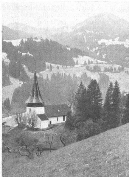
Die Kirche von Erlenbach. (Fotobol.)

Blick ins breit und freundlich sich öffnende Diemtigtal steigen wir rechts zu dem „Bergli“ genannten schönen Wiesenplateau hinauf, von wo wir, das Simmental überschauend, auf