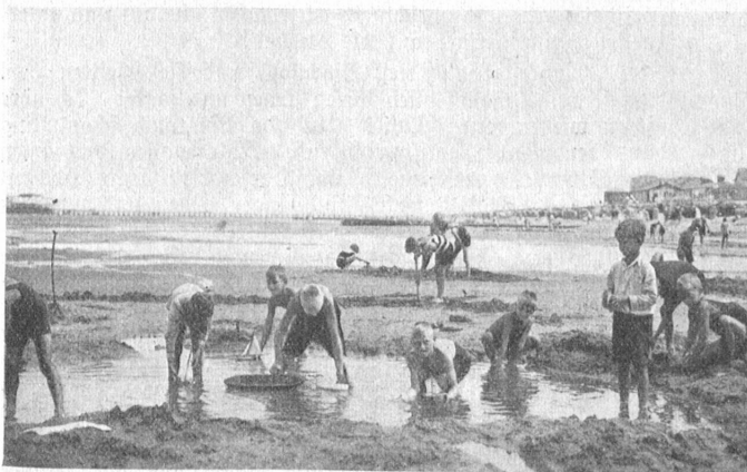
Fröhliches Spiel der Knaben im Schlick (Wattenmeer).