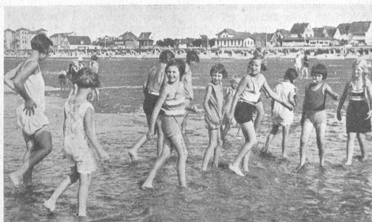
Die Flut kommt, Heimwanderung.

Es war ja glücklicherweise so, daß unsere Schweizer Buben und Mädchen im Alter von 12—17 Jahren im allgemeinen gesund waren und sich keinerlei, aus gesundheitlichen Gründen gebotenen Beschränkungen auferlegen mußten, wie das bei den deutschen erholungsbedürftigen Kindern zumeist der Fall war. Deshalb durften auch unsere Buben